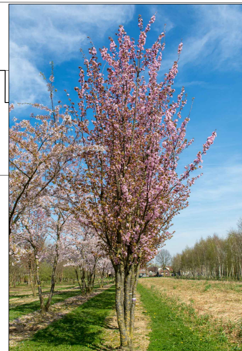
Prunus sargentii rancho