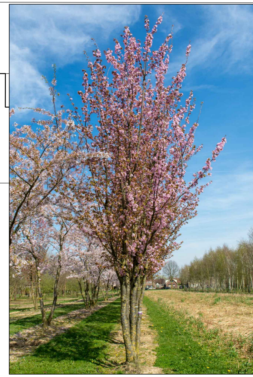
Prunus sargentii rancho