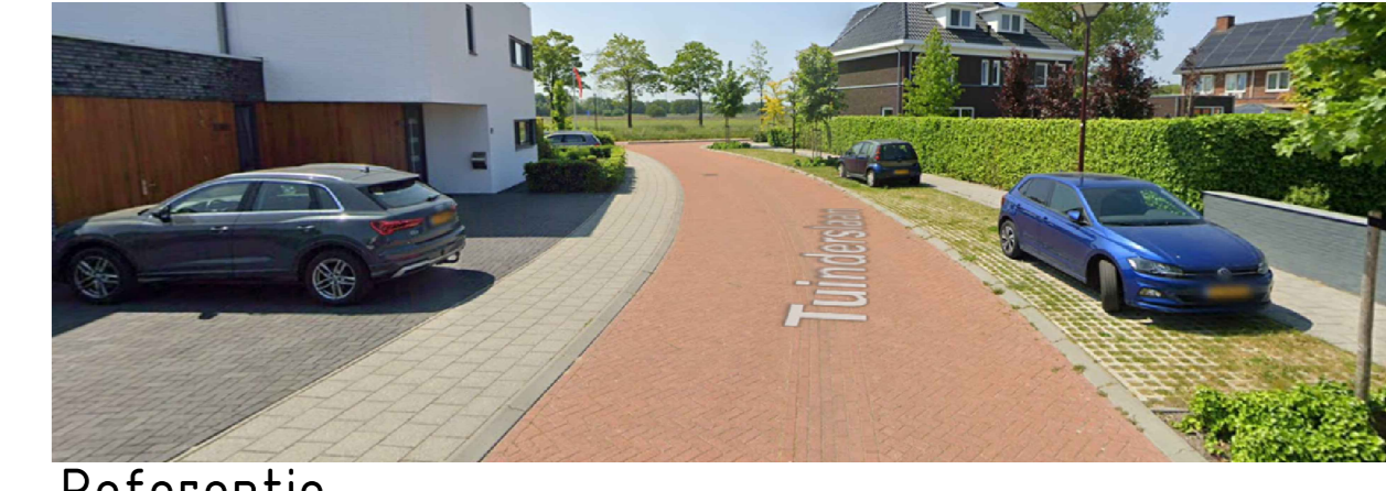
Referentie TUNDERSLAAN TE OUDENBOSCH