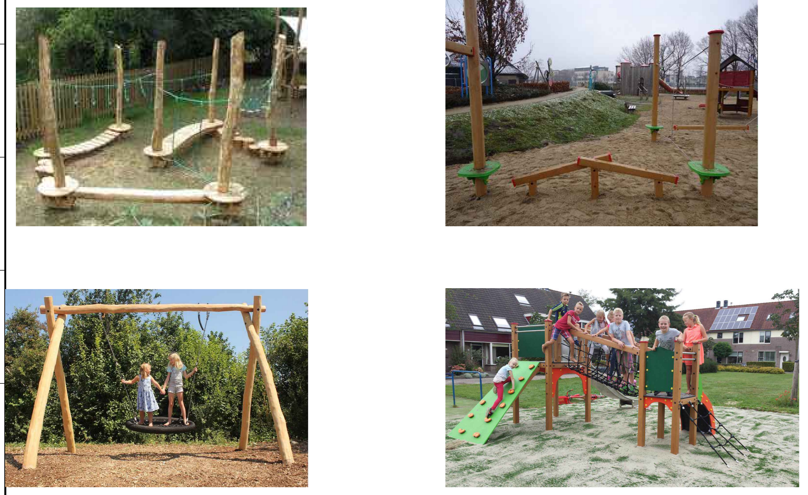
Mogelijke invulling speelterrein